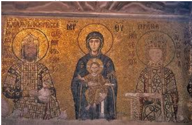
Ψηφιδωτά στην Αγία Σοφία